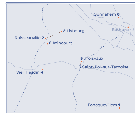
Itinéraire tournée à vélo